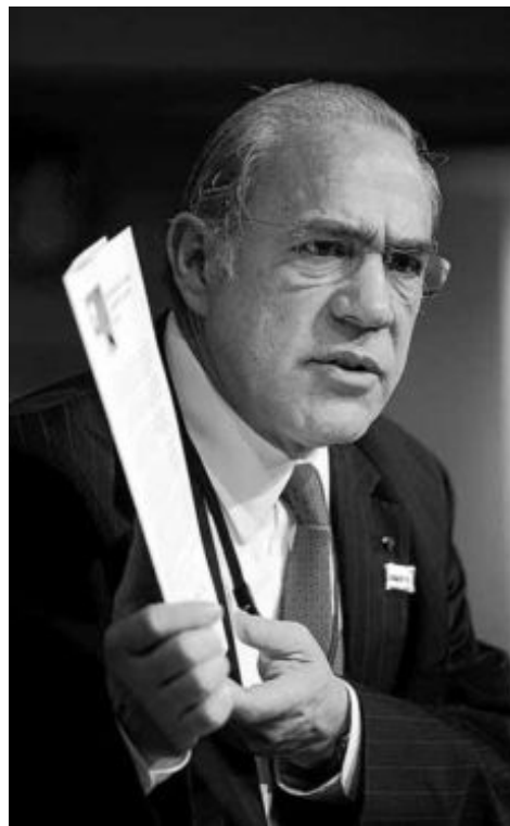
El secretario general de la OCDE, Ángel Gurría.

En el terreno de las comparaciones es donde se aprecia la gravedad que está tomando el desempleo en España. Haría que juntar todos los parados de Francia (2,9 millones) y Canadá (1,5 millones) para alcanzar una bolsa de desempleados similar a la española. O, si se quiere, los de Japón (3,4 millones), Australia (653.073) y la República Checa (418.000). Asimismo, sólo sumando a los parados de Alemania (3,2 millones), Portugal (566.000) y Hungría (449.000) se alcanzaría un vo-