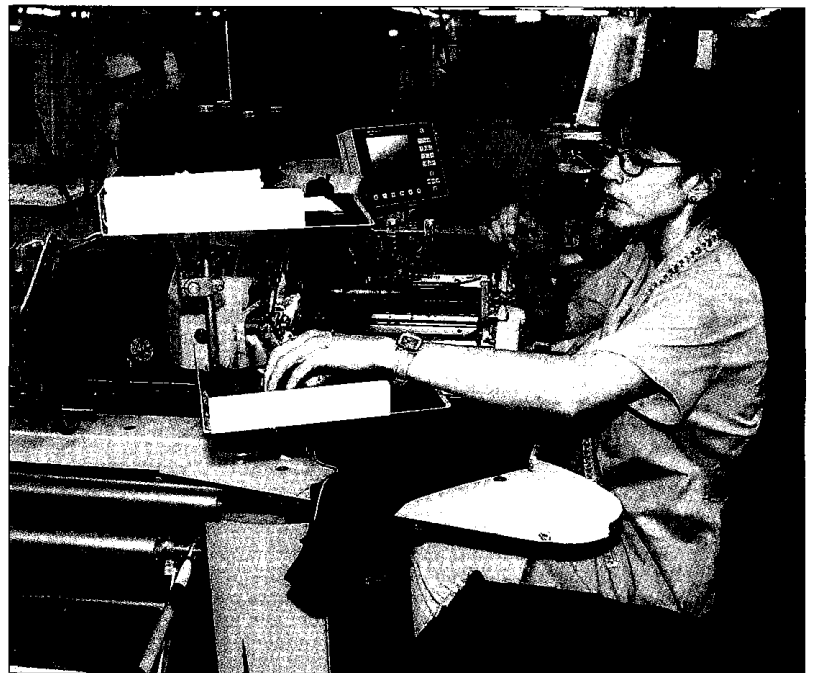
Los segmentos textiles con mayor impacto de mano de obra se seguirán trasladando a países emergentes.

Por si fuera poco, las importaciones de países emergentes han mantuvieron su progresión al alza, a pesar del retroceso general de las importaciones. Sólo en el primer semestre del año pasado China, India y Bangladesh aumentaron un 7% sus ventas en el mercado español, retrocediendo un 11% las importaciones de la Unión europea (UE), con bajas significativas de proveedores tan relevantes como Italia (-21%), Francia (-30%) y Ale-